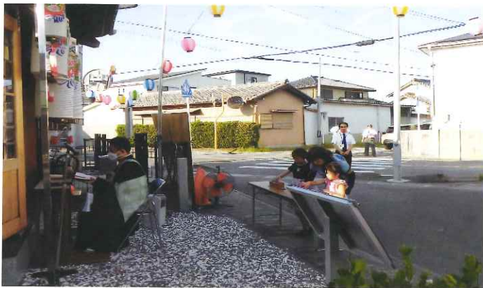
若林西町での風景