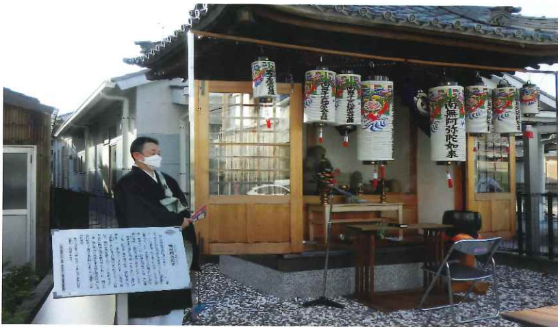
円楽寺ご住職の法話風景