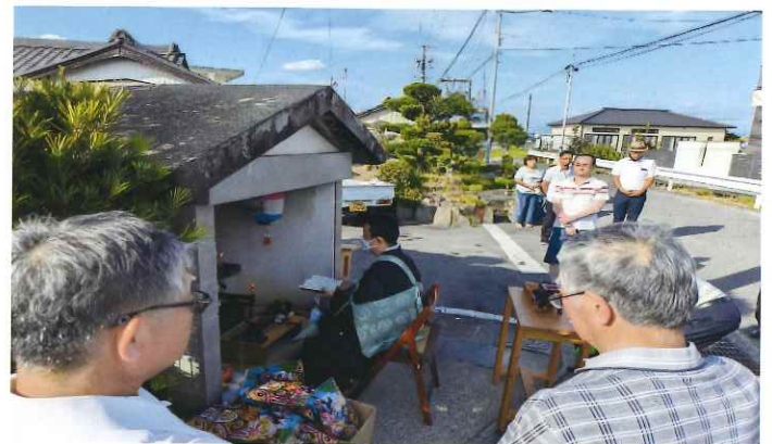
若林東町での風景