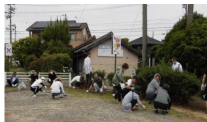
<西町茶屋間の皆さん>

6月9日(日)、16日(日)「春の環境美化」活動には、早朝から区民の皆様にはご協力を頂き、誠にありがとうございました。自治区内大変きれいになりました。